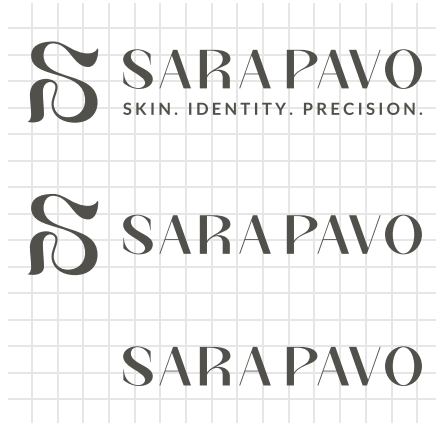
Sekundärlogo (für querformatige Anwendungen)